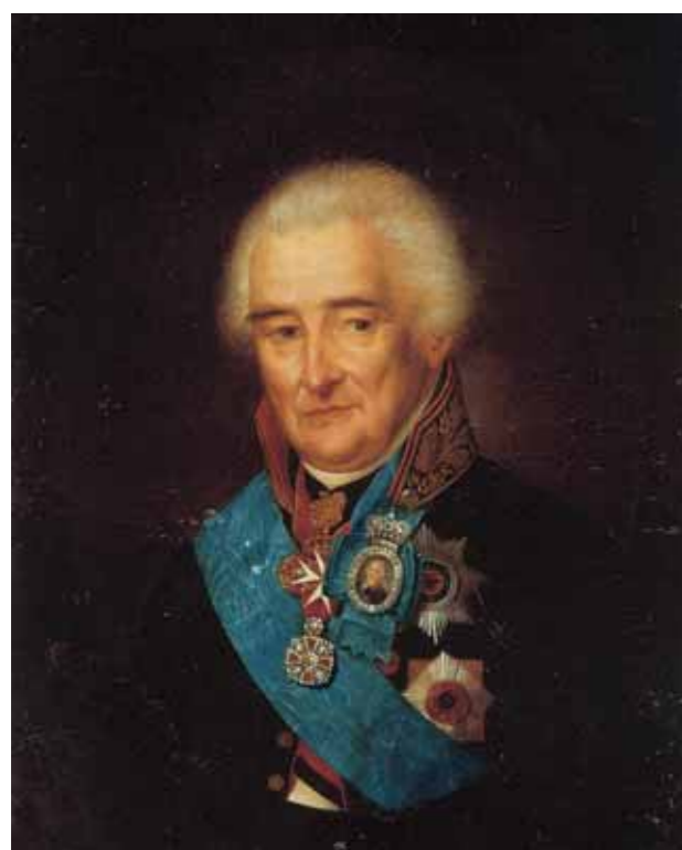
S.S.SHCHUKIN Portrait of Count P.V.Lopukhin. 1826 Картон, масло 16,5×13,2

The 18th century is represented by V.L.Borovikovsky, even S.S.Shchukin (whose works are very rarely found in regional collections) and slightly over 100 other portraits. 18th century artists who earned great popularity among Russian art-loving clients include