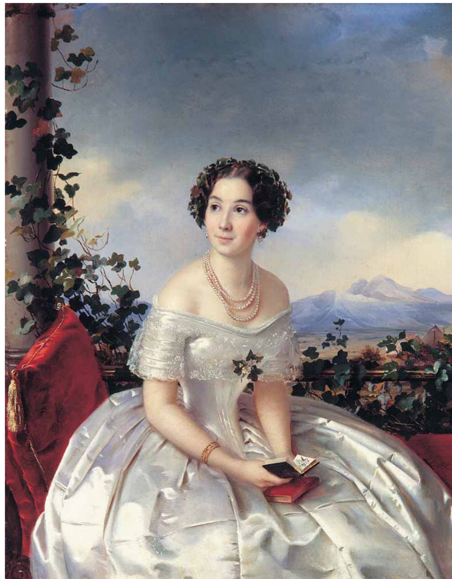
S.K.ZARYANKO ▶ Portrait of an Unknown Woman. 1840s Oil on canvas 54.5 by 46.2 cm