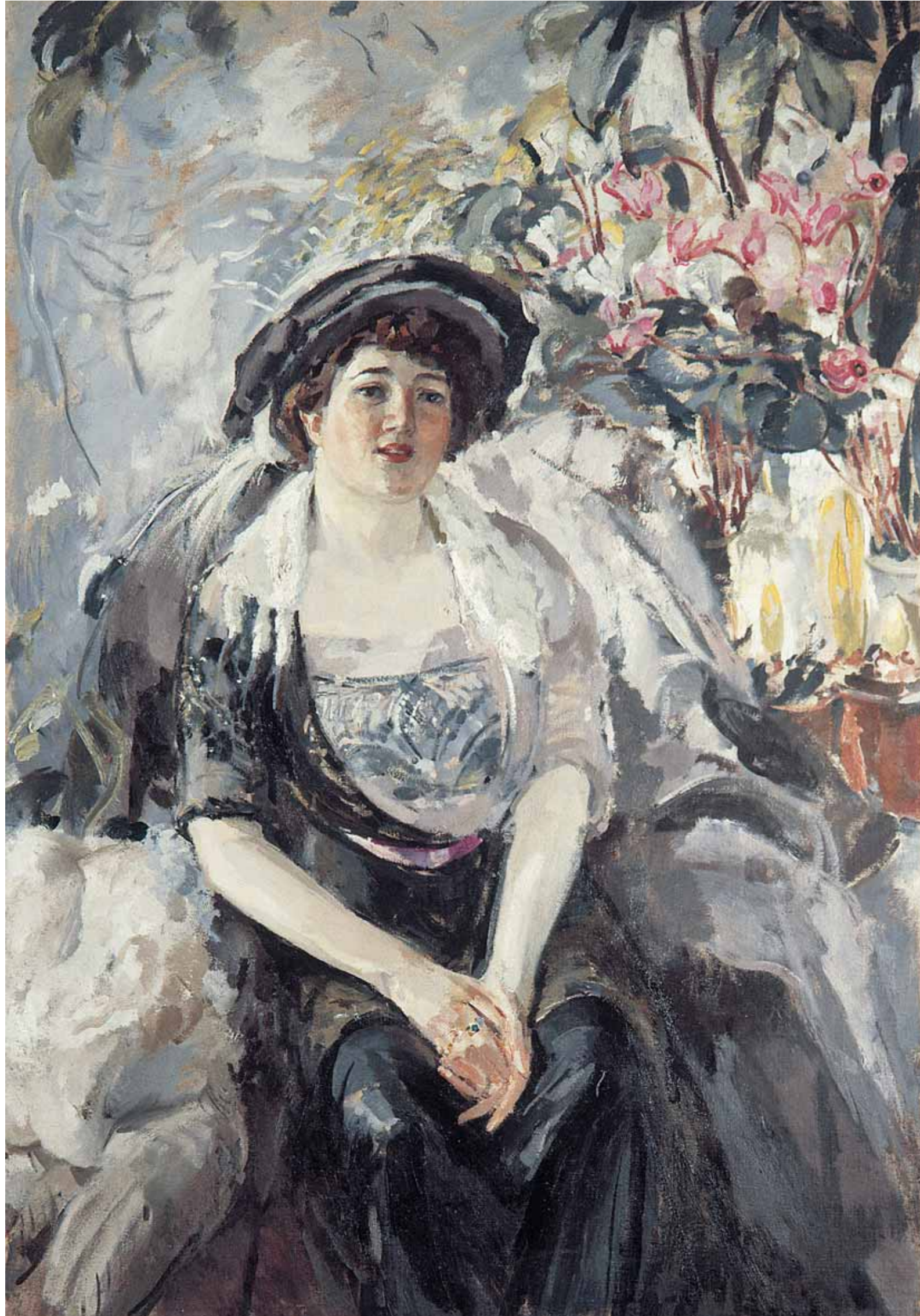
Надежда Васькова Наталья Толстая

Пейзаж второй половины XIX века представлен как лирической линией А.К.Саврасова и Ф.А.Васильева, так и эпическими полотнами И.И.Шишкина, И.К.Айвазовского и А.П.Боголюбова.