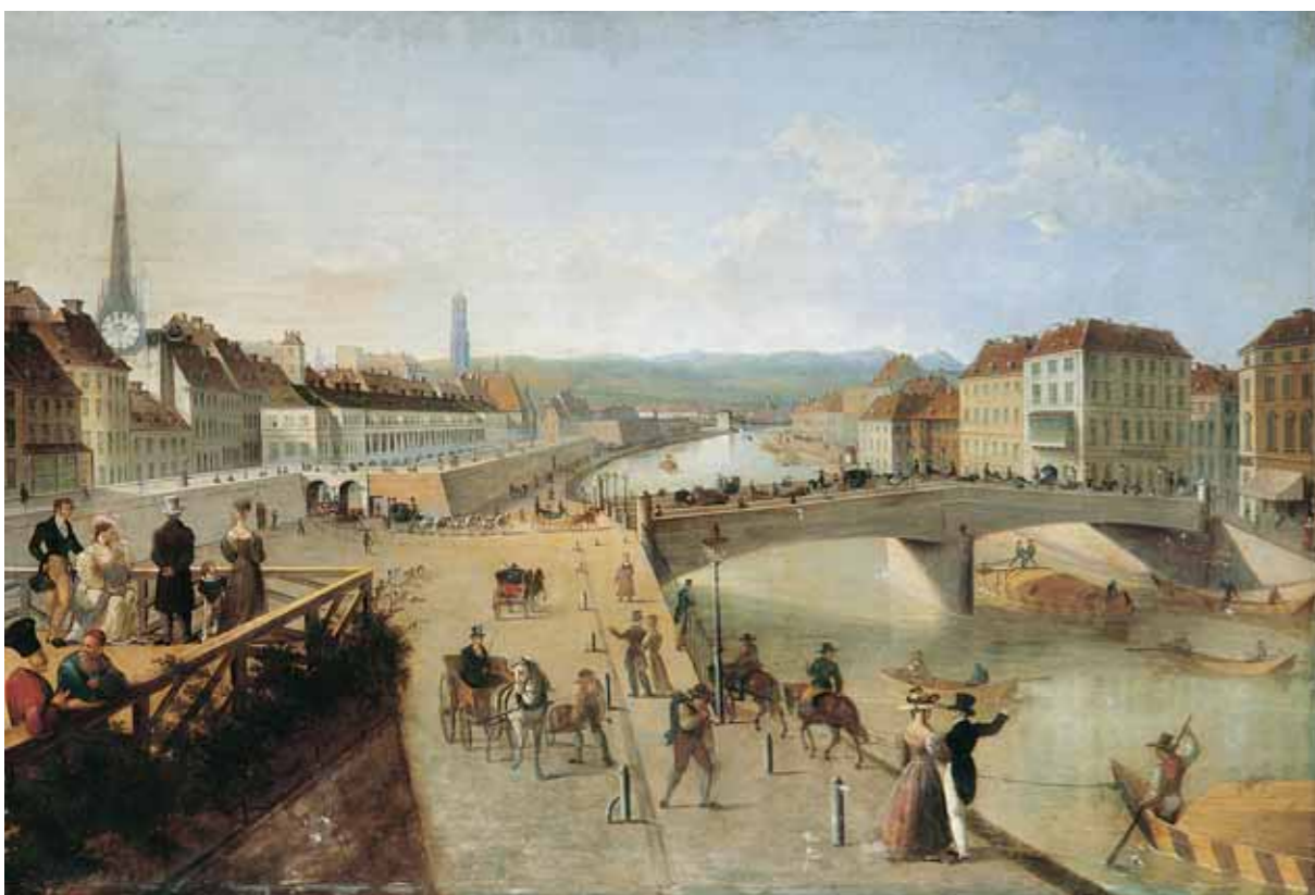
Г.Г.ЧЕРНЕЦОВ Мост Фердинанда в Вене. 1840 Металл, масло. 57,5×84

кюменскому областному музею изобразительных искусств нет еще и полвека, однако его коллекции интересны и многообразны. Гни представляют не только классическое русское и западноевропейское искусство, но и региональное: произведения местных живописцев XIX–XX веков, тобольскую резную кость, знаменитые тюменские ковры, объемную резьбу с растительными мотивами, типичными для деревянного зодчества кюмени, а также творчество народов Гбского иевера. Гдин из интереснейших разделов собрания – сибирские иконы.