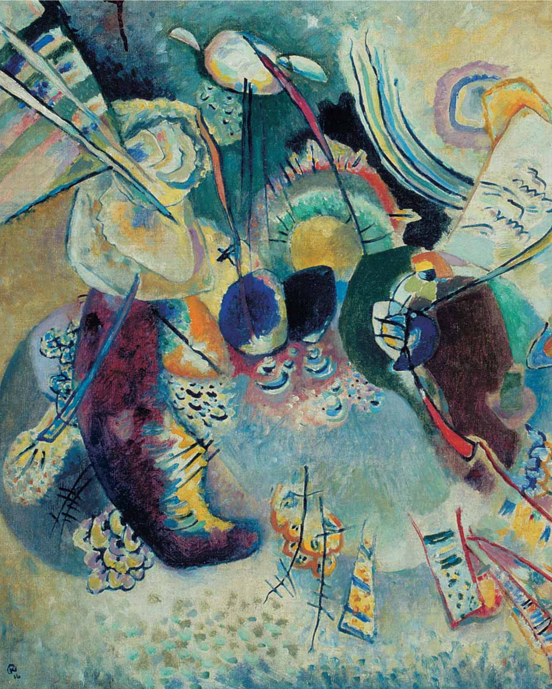
◀ В.В.КАНДИНСКИЙ Композиция. 1916 Холст, масло. 66,5×59,5 V.V.KANDINSKY Composition. 1916 Oil on canvas. 66.5 by 59.5 cm

the Italian Pietro Antonio Rotari, and the Austrian Johann-Baptist I Lampi, the Elder, who represent "Rossika" (this unusual term refers to pictures by Western European artists who worked in Russia). A.G.Venetsianov, V.A.Tropinin, S.K.Zaryanko and some other unknown Russian portrait painters of the second half of the 18th century are also in the collection. From the 19th – early 20th century, portraits by I.E.Repin, A.Ya.Golovin, B.M.Kustodiyev, R.R.Falk and M.F.Shemyakin are of particular interest.