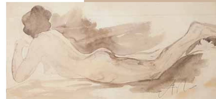
А.С.ГОЛУБКИНА Лежащая натурщица 1890-е. Этюд Бумага, сепия