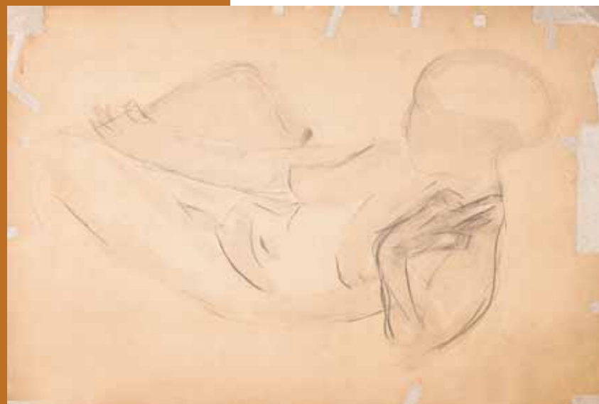
А.С.ГОЛУБКИНА Лежащая натурщица. 1890-е Этюд Бумага, картон, акварель