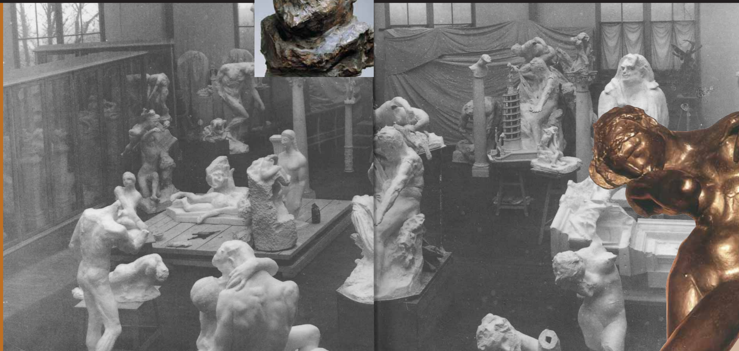
А.С.ГОЛУБКИНА Портрет С.Т.Морозова 1902. Гипс тонированный

В 2004 ГОДУ ИСПОЛНИТСЯ 140 ЛЕТ СО ДНЯ РОЖДЕНИЯ А.С.ГОЛУБКИНОЙ, ОДНОГО ИЗ ЛУЧШИХ РУССКИХ СКУЛЬПТОРОВ НОВОГО ВРЕМЕНИ. ОТМЕТИТЬ ЭТУ ДАТУ ОЧЕРЕДНОЙ ПЕРСОНАЛЬНОЙ ВЫСТАВКОЙ? ТАКАЯ ИДЕЯ НИКОГО НЕ УВЛЕКЛА: В МОСКВЕ ЕСТЬ ПРЕКРАСНЫЙ МУЗЕЙ-МАСТЕРСКАЯ АННЫ СЕМЕНОВНЫ В МАЛОМ ЛЕВШИНСКОМ ПЕРЕУЛКЕ, В ДОМЕ, ГДЕ ОНА ЖИЛА И РАБОТАЛА, И ЭТО УЖЕ В КАКОЙ-ТО МЕРЕ «ПЕРСОНАЛЬНАЯ» ВЫСТАВКА, ТОЧНЕЕ, ПЕРСОНАЛЬНАЯ ЭКСПОЗИЦИЯ.